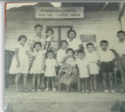
สตูลในอดีตเมื่อปี 2505