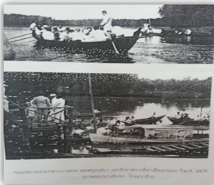
คณะของพลเอกพระยาพหล พลพยุหเสนา และข้าราชการที่ท่าเรือเกะนง ปีพ.ศ. 2476

คณะของพระยาพหล พลพยุหเสนา และข้าราชการที่ท่าเรือเกะนง ปี พ.ศ. 2476