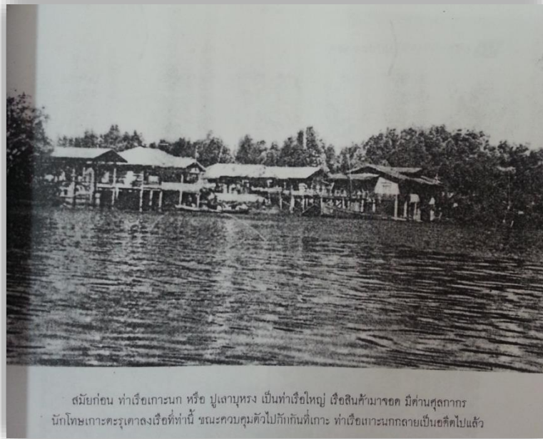
สมัยก่อน ท่าเรือเกะนง หรือ ปูเลาบุหรง เป็นท่าเรือใหญ่ เรือสินค้ามาจอด มีตำนานศาลการ นักโทษเกาะตะรุเตาลงเรือที่ท่านี้ ขณะควบคุมตัวไปกักกันที่เกาะ ท่าเรือเกะนงกลายเป็นอดีตไปแล้ว

สมัยก่อน ท่าเรือเกะนงหรือ ปูเลาบุหรง เป็นท่าเรือใหญ่ เรือสินค้ามาจอด มีตำนานศาลการ นักโทษเกาะตะรุเตาลงเรือที่ท่านี้ ตัวไปกักกันที่เกาะ ท่าเรือเกะนงกลายเป็นอดีตไปแล้ว